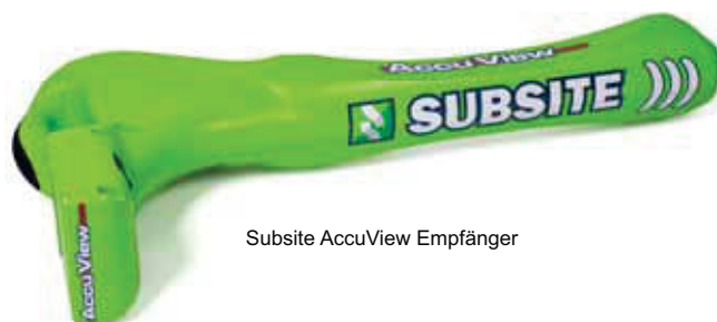
Subsite AccuView Empfänger